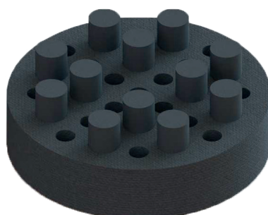
Afbeelding 2.0: Verwijderbare segmenten