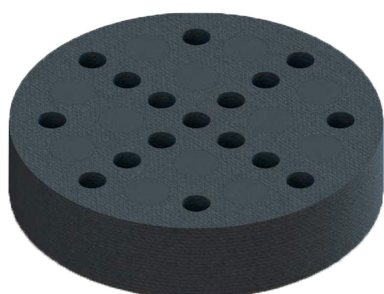
Afbeelding 1.0: Stand 0

De hoeveelheid te verwijderen segmenten wordt bepaald aan de hand van de hoeveelheid lucht die gewenst is. Door het verwijderen van kunststof delen wordt de doorlaat van de regelmodule vergroot. Hierdoor kan bij verschillende werkdrukken de juiste luchthoeveelheid worden bepaald. Zie tabel 1.0.