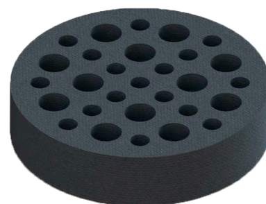
Afbeelding 3.0: Stand 12